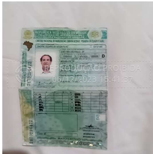
official_document_front_06 dez 2023, 15-41-37.png

Foto da frente do documento oficial com hash SHA256 prefixo b912a3(...)