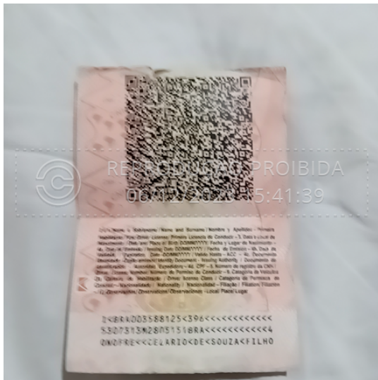
official_document_back_06 dez 2023, 15-41-37.png

Foto do verso do documento oficial com hash SHA256 prefixo c7bbf8(...)